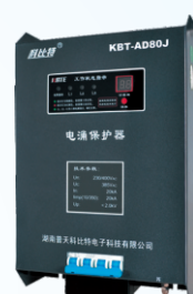
带雷电计数三相电源防雷箱